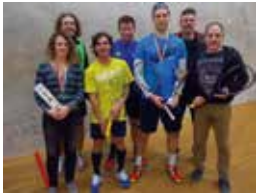
Die Sieger des Jahres 2016

Der WSRV hat im Vorjahr in einen aufblasbaren „Mini-Court“ angeschafft (5,2m x 6m x 3m B/L/H) welcher ideal für Sportfeste, Schulveranstaltungen und öffentliche Events ist. Mit diesem Mini-Court wollen wir die Kinder für den Squash-Sport interessieren und in die Anlagen bringen.